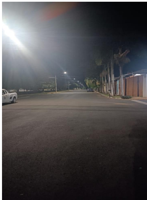
Rua Saulo Garcia Novo

Foram tiradas algumas fotos das vias reclamadas para que se possa verificar a iluminância dos locais. Verificamos, que tais vias possuem iluminância média adequada conforme norma.