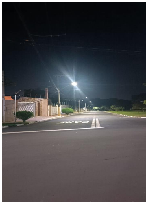
Rua Virgulina Rios Salvatto