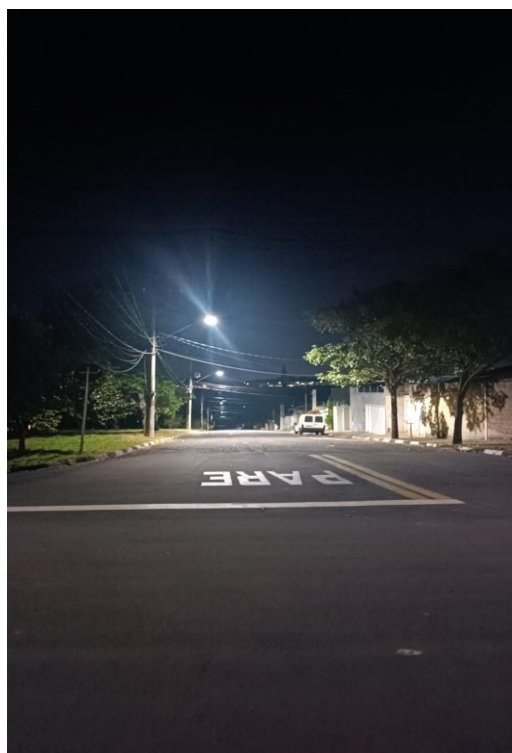
Rua Profª Nancy de Carvalho Pigozzi